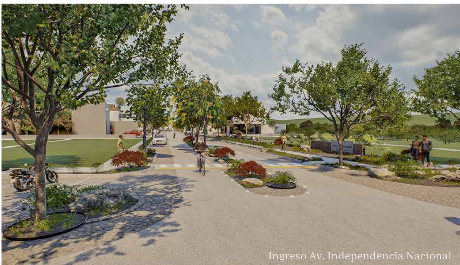
Ingreso Av. Independencia Nacional